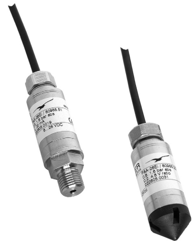
Серия 26 Q